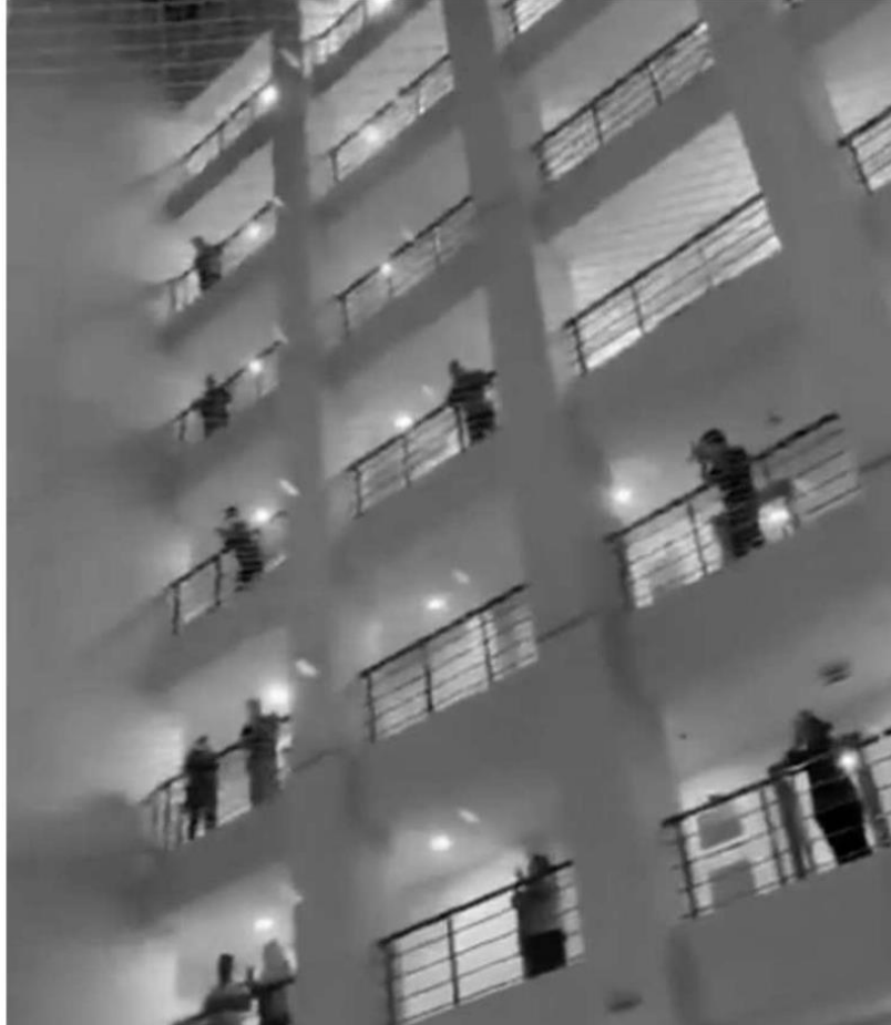
Karantina altına alınan 191 kişi, saatler 21.00'i gösterdiğinde koronavirüsle mücadele sürecinde 24 saat gayretle çalışan sağlık personelleri için 1 dakika boyunca alkış tuttu.